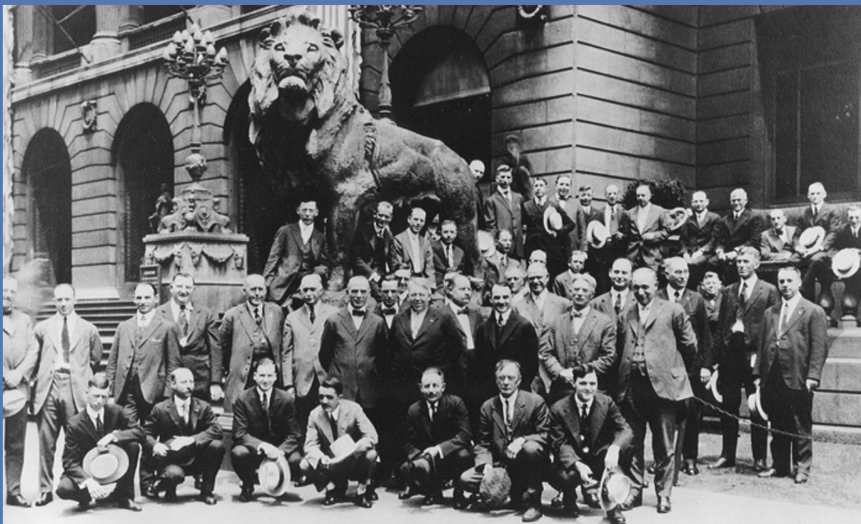
Il 7 giugno nasce a Chicago, nell'East Room dell'Hotel La Salle, The International Association of Lions Clubs che tiene la sua prima convention a Dallas, in Texas, dall'8 al 10 ottobre dello stesso anno. Pagina precedente: Melvin Jones.