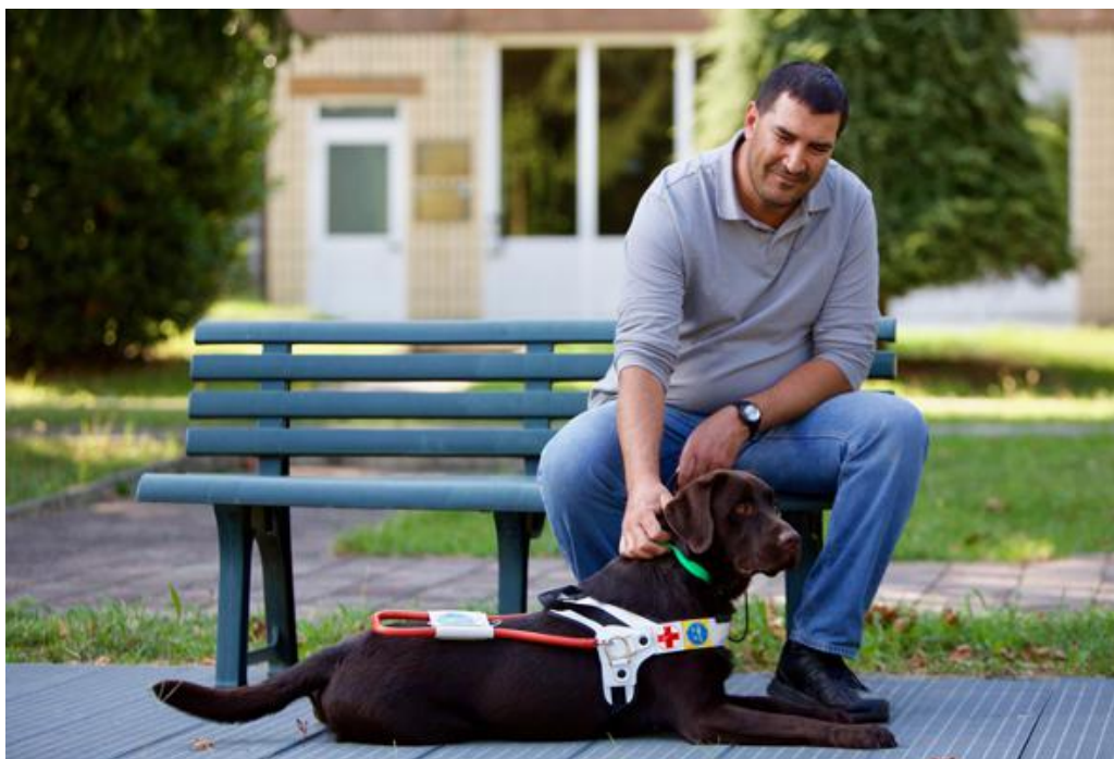
MULTIDISTRETTO LIONS 108 ITALY 2018-2019

Quello digitale è un mondo veloce, fatto di istanti. Istanti che devono catturare regalando emozioni. Come i nostri Service che sono, in primo luogo, l'emozione assoluta del Dare.